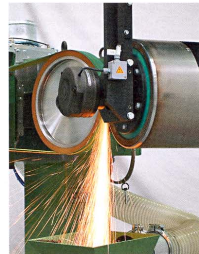
Detailansicht: Schleifen einer umlaufenden Schweißnaht an sogenannten Säulenbecken

und dies bei optimierten Schleifmittelverbrauch, eine Herausforderung dar. Gelöst wurde diese Aufgabenstellung mit einer Carat-spezifischen Roboterbandschleifmaschine. Der eingesetzte Kuka ist in diesem Fall für das Handling der Bauteile während der Bearbeitung zuständig. Die Beschickung erfolgt über Schiebetische, die von einem Mitarbeiter bestückt wer-