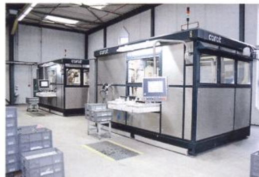
Die Gavaro-Zellen können aufgrund der höheren Produktionsgeschwindigkeit in den kompletten Produktionsablauf eingebunden werden

ten bereits verschiedene Beschichtungsverfahren realisiert werden, so • dekoratives Glanzverchromen komplexer Sanitärarmaturen, • Verkupfern von Messingbauteilen, • Hochgeschwindigkeits-Hartverchromen von Motorbauteilen und • Veloursvernickeln von Schließsystemen.