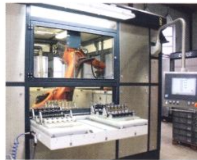
Die Ausschussrate der Roboterlösung liegt unter einem 1 %

Das Handling der Bauteile übernimmt der Roboter. Aufgrund der hohen Bearbeitungsgeschwindigkeit kommt ein Hochgeschwindigkeitselektrolyt zum Einsatz. Damit wird es möglich, auch Artikel mit komplexen Geometrien in kürzester Zeit reproduzierbar zu fertigen. Das Roboterhandling ermöglicht das fehlerfreie Beschichten von flüssigkeitsschöpfenden Produkten, da diese beim Herausfahren aus den Prozessbädern und Spülen ausgekippt werden können. Aber nicht nur komplexe und schöpfende Bauteile, die in der konventionellen Galvanik mit hohem Ausschuss behaftet sind, können mit dieser Anlagentechnik beschichtet werden, sondern auch Bauteile einfacher Geometrien. Die Einsatzgebiete der Gavaro-Anlage sind, wie das modulare Zellenkonzept zeigt, vielfältig. Es kann